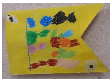
たんぼぼぐみ（4歳児）